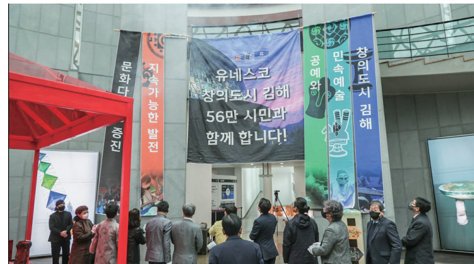
김해시, 창의도시 선포식

김해시는 창의도시로 새롭게 나아가고자 2022. 8월 창의도시 발전계획수립 용역에 착수하였습니다. 9월에는 다양한 분야의 전문가와 종사자들로 창의도시 자문위원회를 구성하였으며, 첫 회의에서 용역에 대한 자문을 받았습니다. 이후 실태조사, 설문조사, 인터뷰, 토론회 등을 통해 의견을 반영하여 2023년 1월경 발전계획을 확정할 예정입니다.