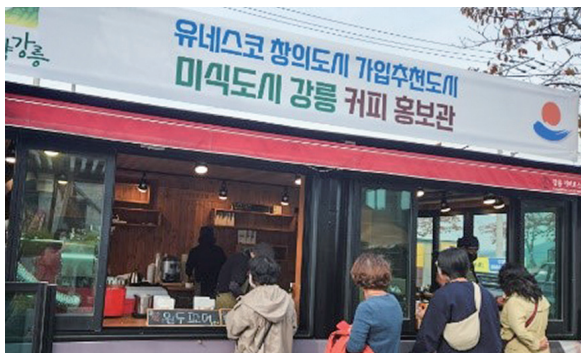
강릉커피축제 - 김해도자기 전시·판매(위) 김해분청도자기축제- 강릉 커피 판매(아래)